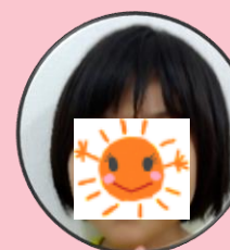
〇〇〇 〇〇〇ちゃん 〇さい