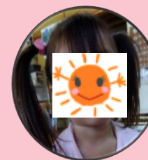
〇〇〇 〇〇〇ちゃん 〇さい