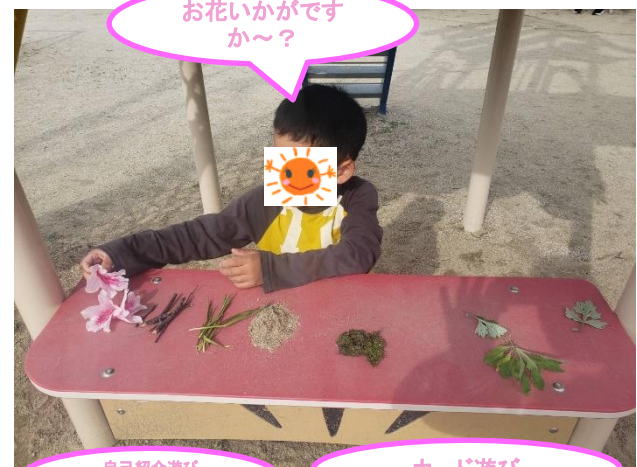
お花いかがですか～？