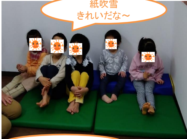
紙吹雪 きれいだな～