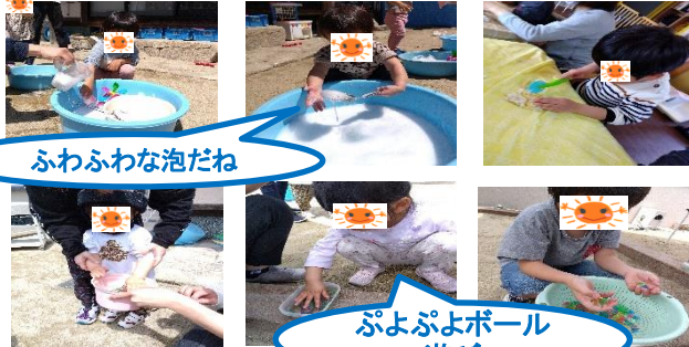
ふわふわな泡だね