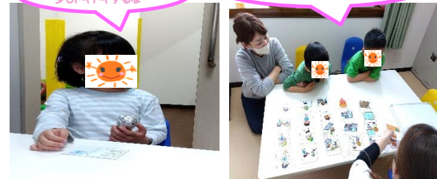
自己紹介遊び 少しドキドキするな～