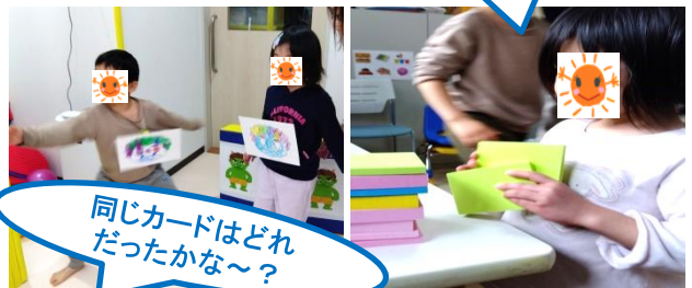
同じカードはどれ だったかな～？