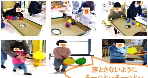
落とさないように そーっと…そーっと…