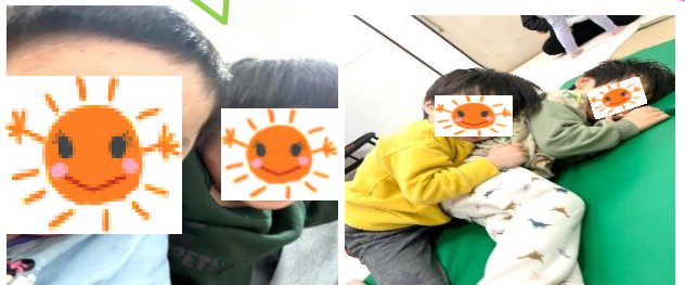
雪が降っ てきたよ～