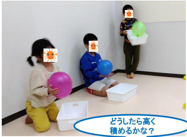
どうしたら高く 積めるかな？