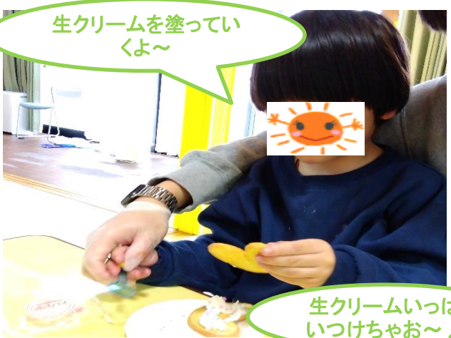
生クリームを塗っていくよ～