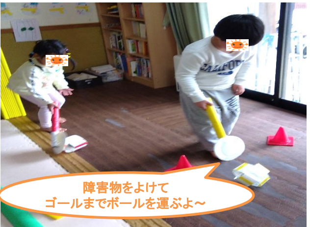
障害物をよけて ゴールまでボールを運ぶよ～