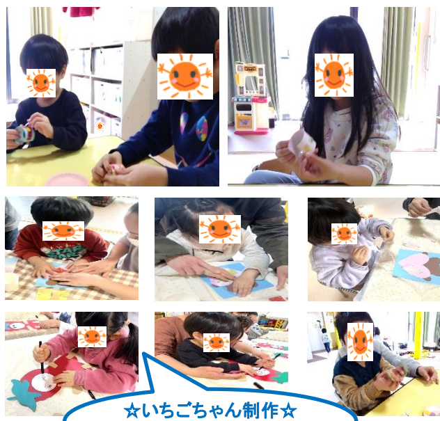
☆いちごちゃん制作☆ ペンでお顔を描くよ～