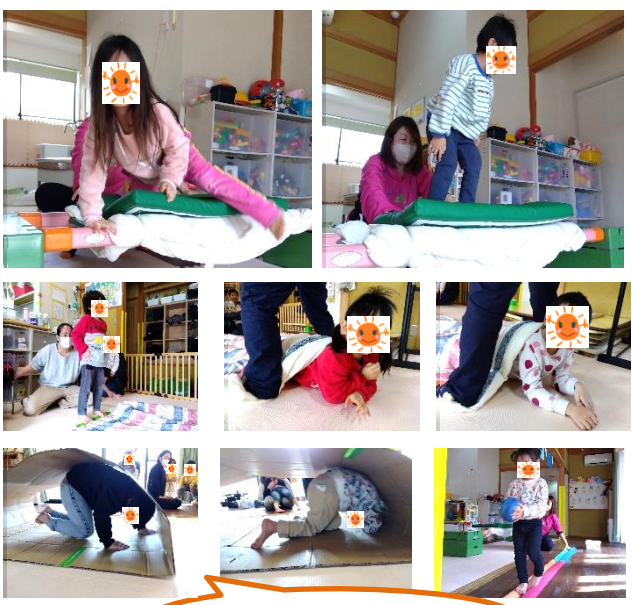
キャタピラー遊び