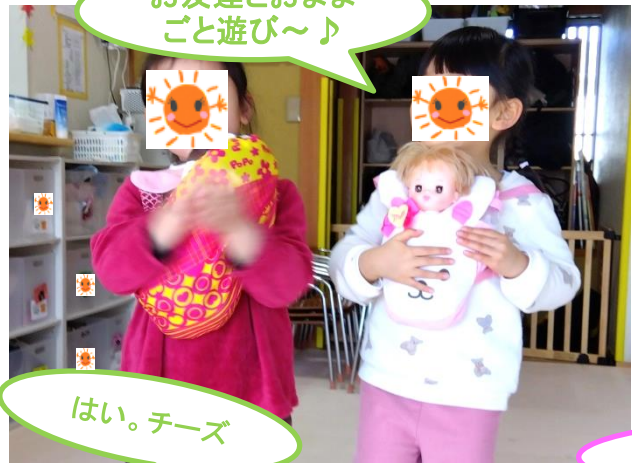
お友達とおまま ごと遊び～♪