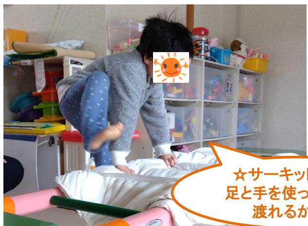
☆サーキット遊び☆ 足と手を使って上手に渡れるかな～