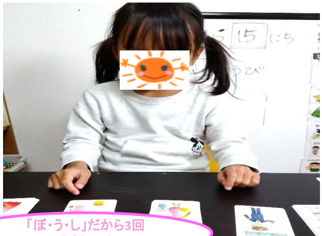
「ぼ・う・し」だから3回 叩くよ～♪