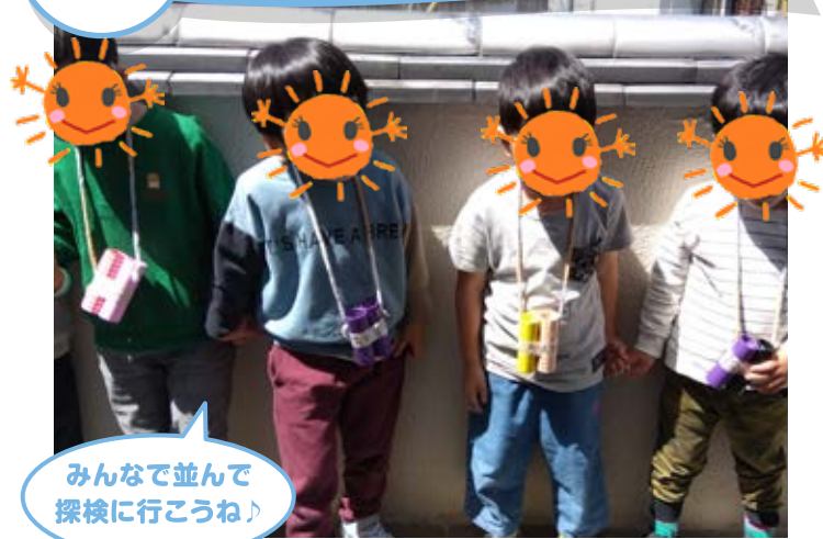
みんなで並んで探検に行こうね!