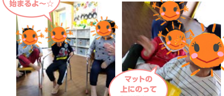
朝の会が 始まるよ~☆