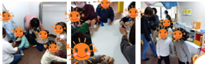
自分の名前をかいてみよう!