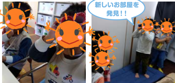
新しいお部屋を発見!!