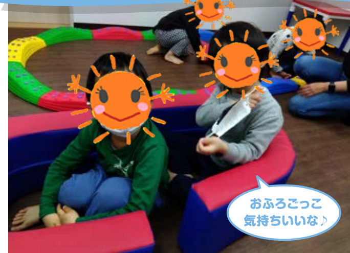
おふろっこ 気持ちいいな♪