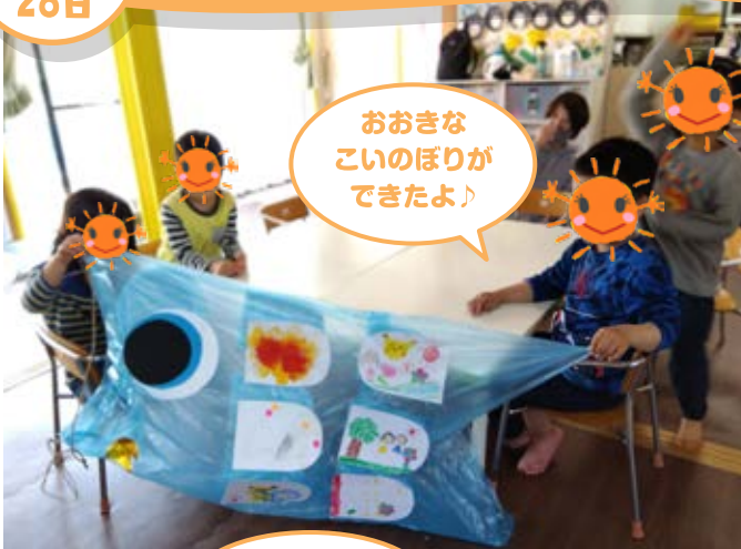
おおきな こいのぼりが できたよ♪