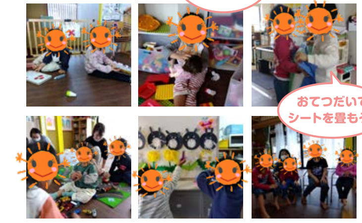
おてついで シートを畳もう!

自由遊びの時間になると、好きな玩具やあそびをして過 しています。一人の子が、おまもごとで赤ちゃんのお世話を していると『〇〇はいる?』『持って来たよ!』とお友達が持っ て来て一緒に遊んでいました♪職員が仲介に入りながら、 人と遊ぶ楽しさをたくさん経験していきましょう☆