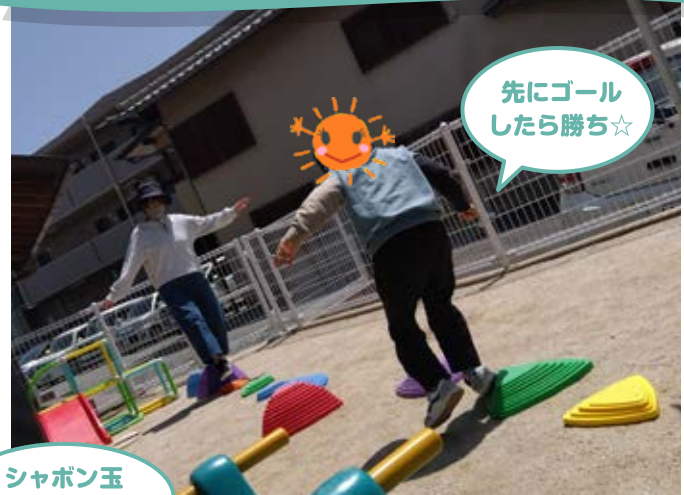
先にゴール したら勝ち☆