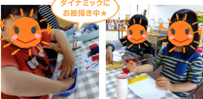
ダイナミックに お絵描き中★