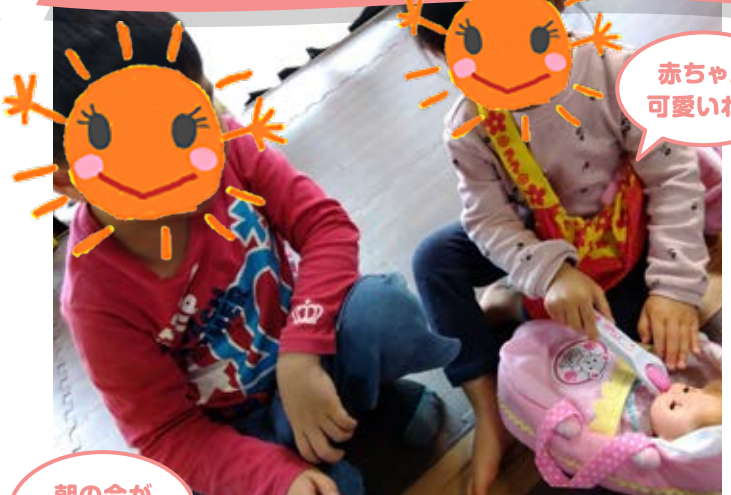
赤ちゃん 可愛いね♪