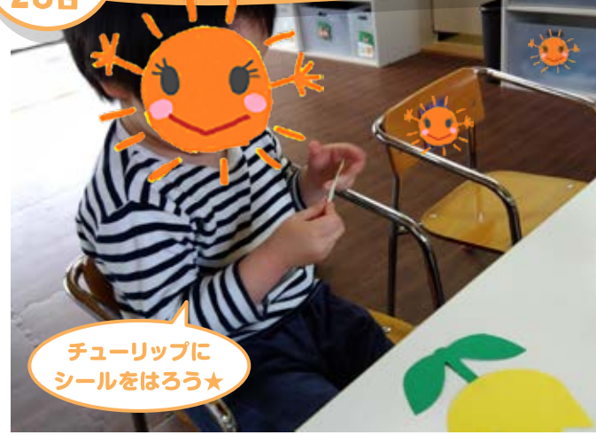
チューリップにシールをはろう☆