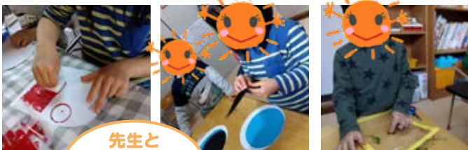
先生と ポケモンカード 対戦中!