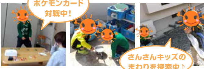
さんさんキッズの まわりを探索中♪

大きなこいのぼりづくり、シャボン玉あそびなどしました☆ 鯉のぼりの鱗づくりでは、洗濯ばさみ・毛糸・スポンジ・綿棒 の身近な物を使ってスタンプをしたり、自由画で「お天気 のいい日は太陽がでているね」「春だからお花も描こうかな」と 職員がお手本をみせ、発想する楽しさを伝えています♪みんな で鱗をつけ協力して作り上げました☆