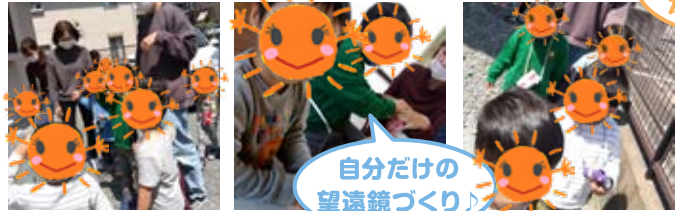
自分だけの望遠鏡づくり♪