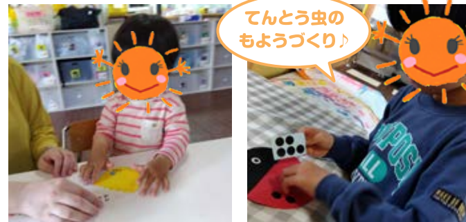
てんとう虫のもようづくり♪