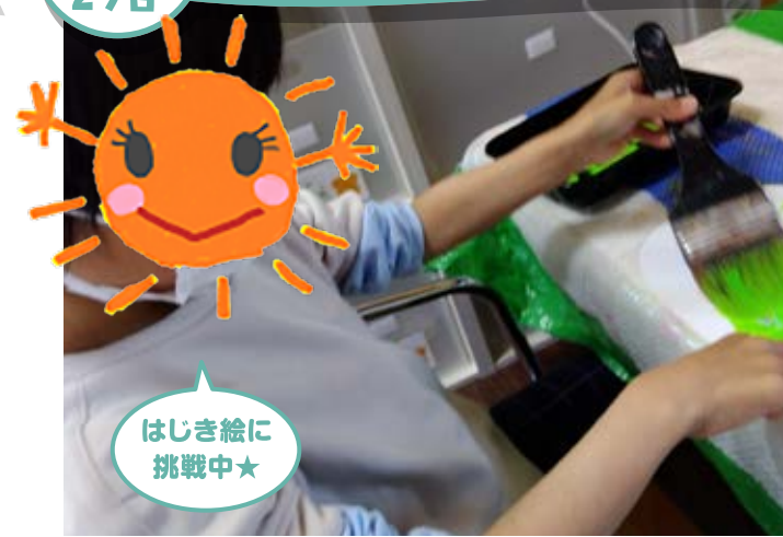
はじき絵に挑戦中☆