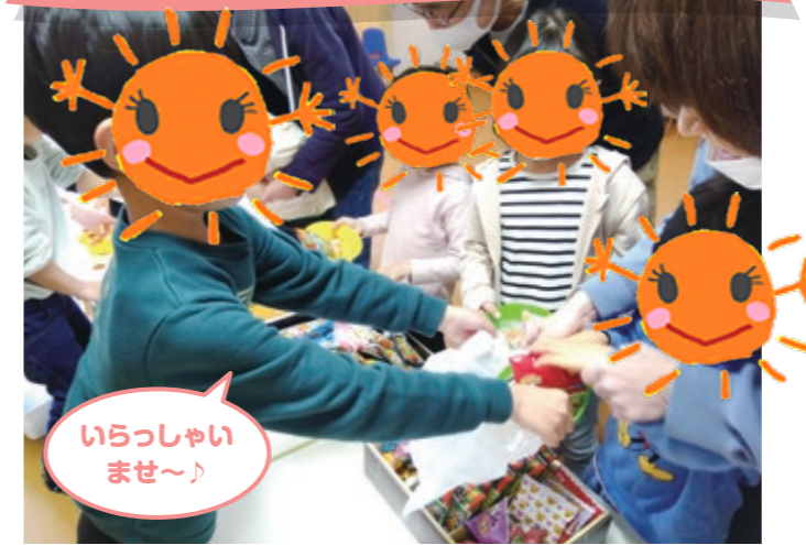
いらっしやい ませ〜♪