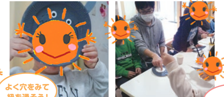
よく穴をみて 紐を通そう!