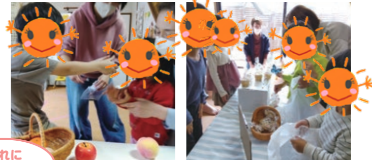
どれに しようかな〜?