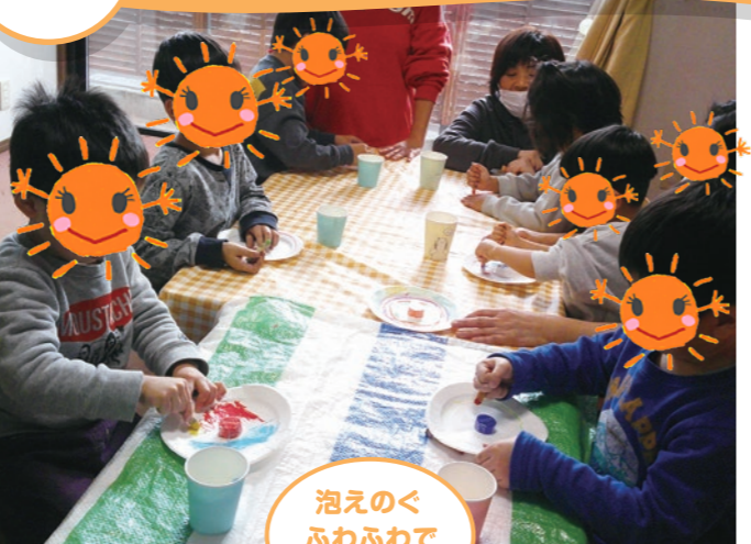
泡えのぐふわふわで不思議☆