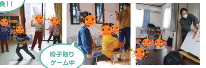
椅子取りゲーム中

パネルシアター、おあつまり、体操など集団での活動では、楽しみを持って活動に参加できることや椅子への着席、相手に注目して話をきくことを大切にしています。最初は、椅子への着席が難しい時は、少し離れた所から→職員の手の上に乗って参加するなど子どもの発達に合わせてスモールステップで取り組んでいきます。