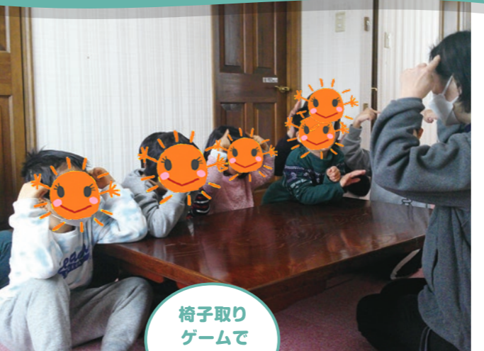
椅子取りゲームで商品GET☆