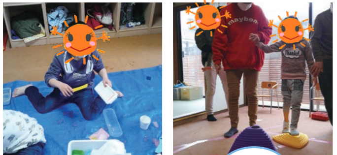
上手に渡れるかな？