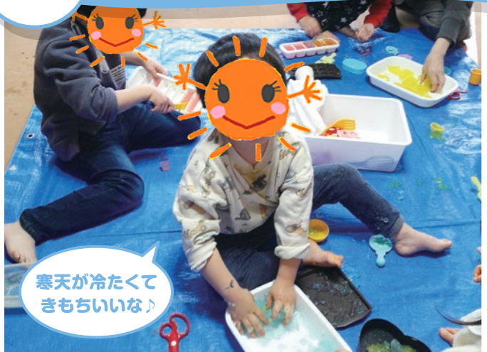
寒天が冷たくてきもちいいな♪