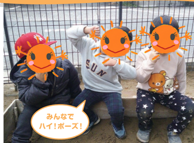
みんなで ハイ!ポーズ!