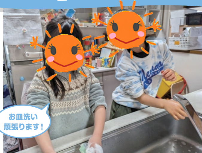
お皿洗い 頑張ります!