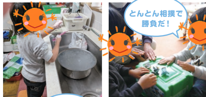
とんとん相撲で 勝負だ!