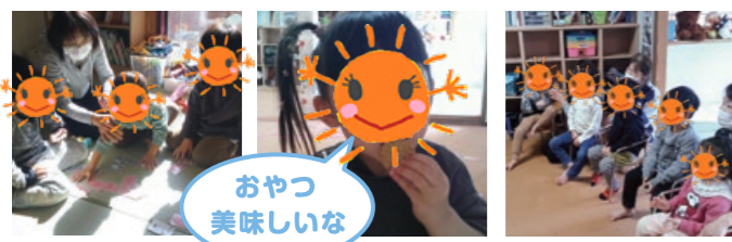
おやつ 美味しいな