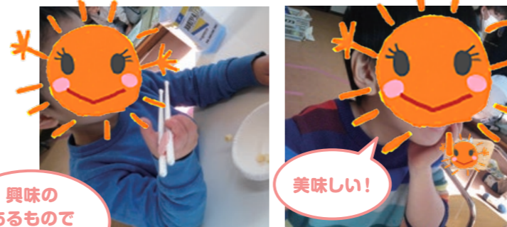
興味 あるもので やってみよう!