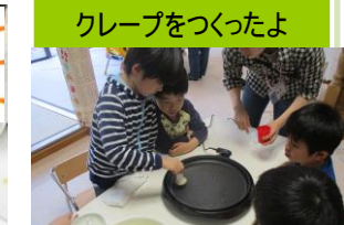
クレープをつくったよ