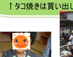
↑タコ焼きは買い出しから！