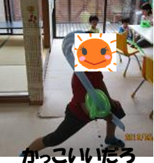
バルーンアートだ