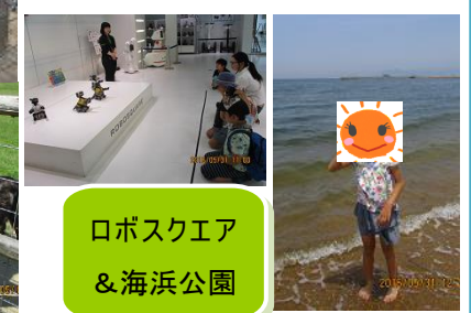
ロボスクエア & 海浜公園