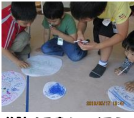
着陸する島をつくらう