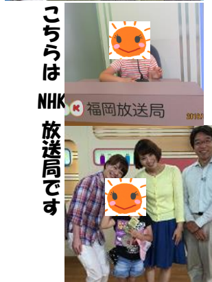
こぎゅうは NHK 放送局です