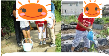
川から水を汲んで苗にあげます