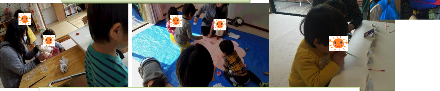
工作作り カップにいろめり・さくらのスタンプ・まどあて